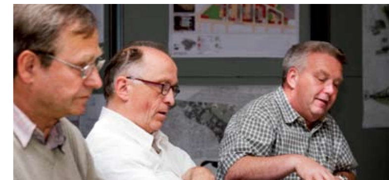
Gedankenaustausch zwischen Projektträgern, Bewohnern und Unternehmern